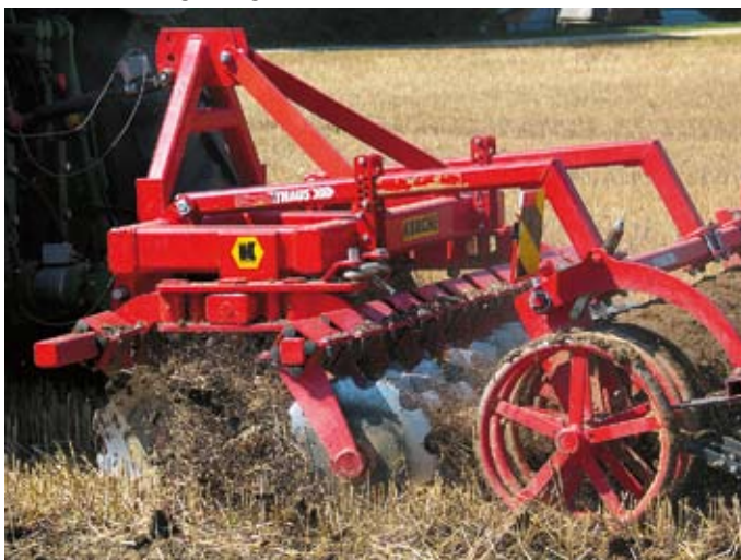
Abb. 3: Kurzscheibeneggen schälen ganzflächig, erlauben flaches Arbeiten (5 cm), verstopfen nicht und sind sehr schlagkräftig. Deren Anschaffung ist allerdings nicht ganz billig, was eine genügende Auslastung bedingt.