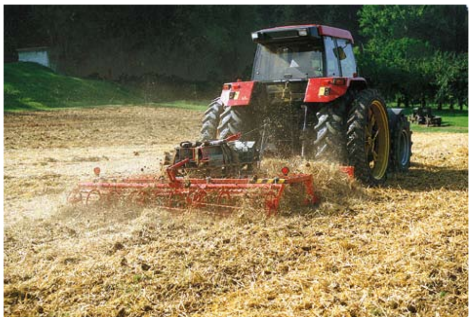
Abb. 5: Spatenrolleggen mischen Stroh oberflächlich ein, besitzen eine hohe Schlagkraft und einen kleinen Zugkraftbedarf. Da sie den Boden nicht ganzflächig bearbeiten, weisen sie bezüglich der Unkrautregulierung Schwächen auf.

Im Vergleich zu den drei- bis vierbalkigen Geräten gehen aufgesattelte Grubberkombinationen, die aus verschiedenen Elementen wie Walzen, Zinken- und Schleppfelder bestehen, noch einen Schritt weiter. Diese gezogenen Geräte bewirken einen intensiven Arbeitseffekt in einem Durchgang. Der hohe Anschaffungspreis und die geringe Wendigkeit liessen bis anhin in der Schweiz kein grosses Interesse aufkommen.