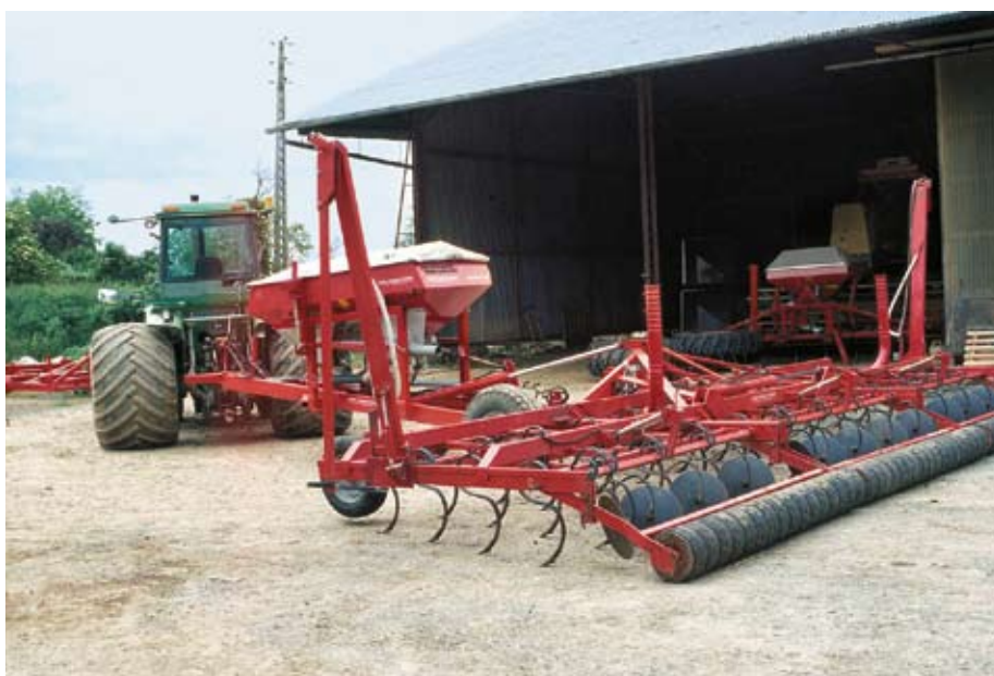
Abb. 2: Ist das Stroh sauber geräumt, eignet sich auch die alte Federzinkenegge für die Stoppelbearbeitung. Eine Weiterentwicklung der französischen Firma Agri-Structures baute aus einer Federzinkenegge eine Säkombination.

Thomas Anken, Forschungsanstalt Agroscope Reckenholz-Tänikon ART, Tänikon, CH-8356 Ettenhausen