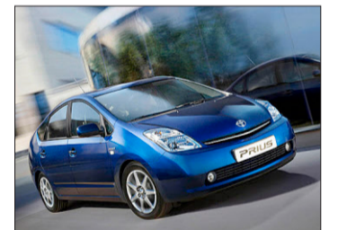
Toyota Prius.

Der deutsche Bosch-Konzern und die südkoreanische Samsung SDI wollen gemeinsam Batterien für umweltfreundliche Hybrid-Autos bauen. Nach Angaben von Samsung SDI soll die Batterieproduktion 2010 beginnen. Der Markt für Hybridfahrzeuge werde sich angesichts steigender Öl- und Kraftstoffpreise und schärferer Umweltauflagen in der Zukunft rasant entwickeln, so die beiden Firmen. Bei Hybrid-Fahrzeugen wird ein Benzinmotor zugeschaltet, wenn die Autos weit oder schnell fahren sollen. Pionier von Hybrid-Fahrzeugen mit kombiniertem Elektro- und Benzinmotor ist Toyota. Seit der Einführung in Japan 1997 verkaufte das Unternehmen mehr als eine Million Fahrzeuge des Modells Prius. age