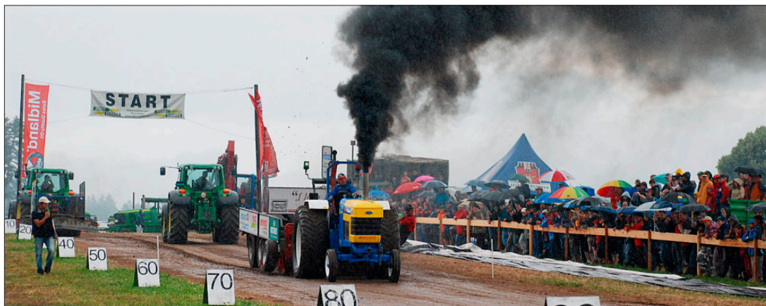
Nasse, glitschige Piste – nach diesem Teilnehmer war am Sonntag Schluss.

Absagen wegen der «1-Zug-Strategie» gab es aber kaum. Wegen anderer Absagen wurde schliesslich nur in der 3-t-Standardklasse mit einem Zug gefahren. Dennoch wollen Guggisbergs einen Vorstoss bei der Schweizer Tractor-Pulling-Vereinigung STPV lancieren, da der Umgang mit grossen Teilnehmerfeldern nicht klar geregelt ist.