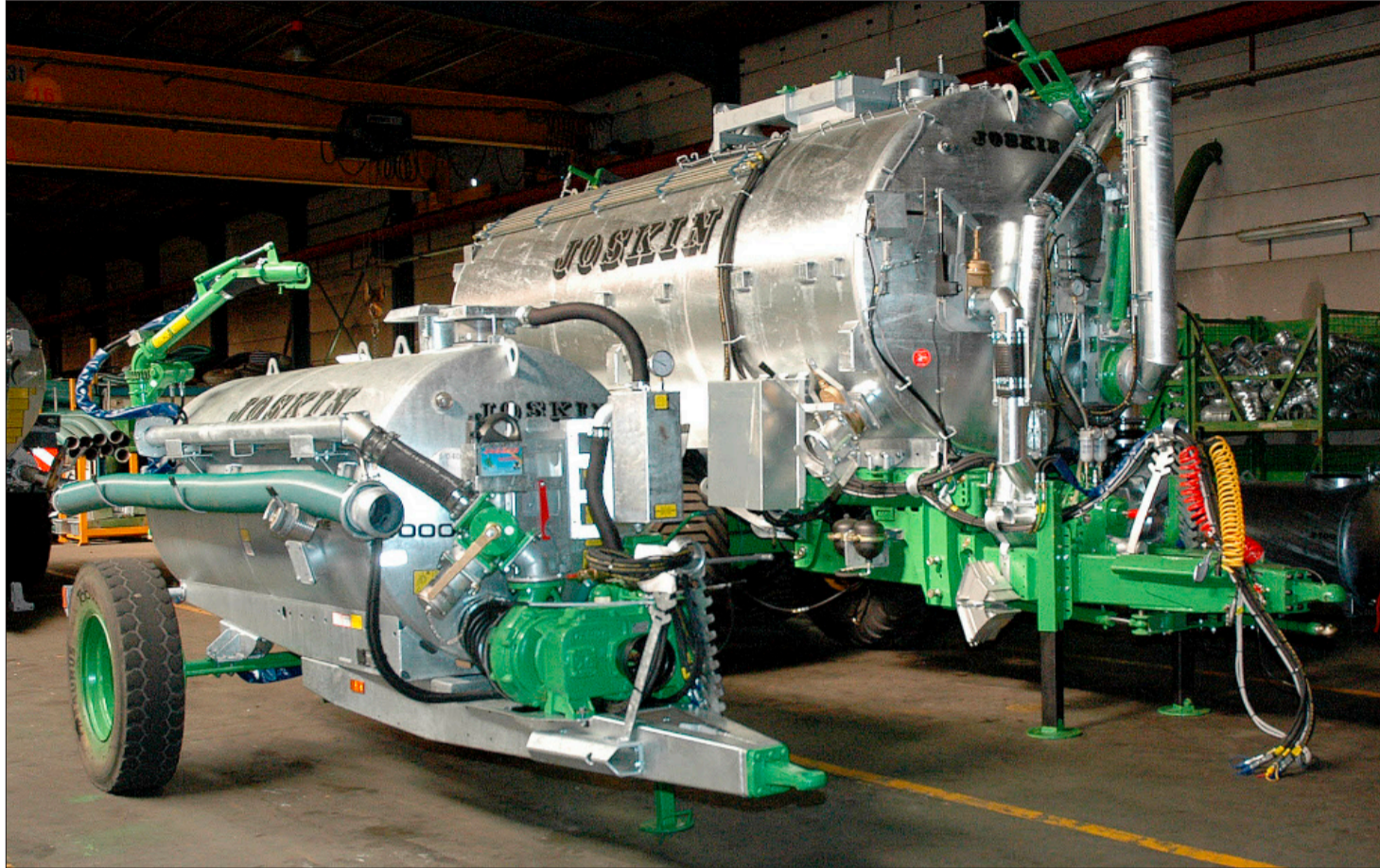
Von 2500 Litern bis 26000 Liter ist bei Joskin alles möglich.

1984 erweiterte Joskin sein Geschäftsfeld. Er stieg in die Produktion von Landmaschinen ein. Zuerst handelte es sich dabei nur um Güllefässer. Natürlich wusste der ehemalige Lohnunternehmer genau, wo seine Kunden der Schuh drückt. Dementsprechend konstruierte er auch Maschinen mit den Qualitätsansprüchen als Lohnunternehmer. Seit dieser Zeit ist die Produktionssparte «Güllefass» stark gewachsen. So feiert Joskin neben dem runden 40. Geburtstag dieses Jahr auch die Auslieferung des 20000. Güllewagens. Im Jahr 2007 wurden über 1800 Güllewagen in den